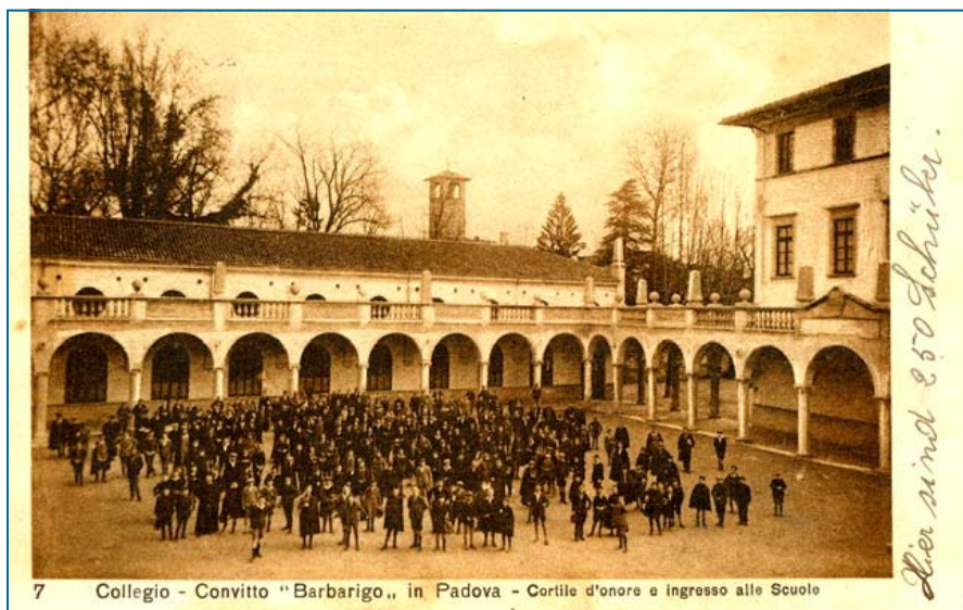
7 Collegio - Convitto "Barbarigo", in Padova - Cortile d'onore e ingresso alle Scuole